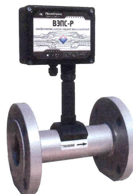
Рисунок 2 – Внешний вид ВЭПС-Р с фланцевым соединением

В целях предотвращения несанкционированного доступа к узлам регулировки и настройки предусмотрено место пломбирования, указанное на рисунке 3.