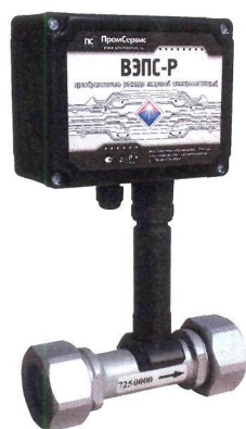
Рисунок 1 – Внешний вид ВЭПС-Р с муфтовым соединением